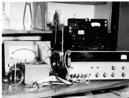
Рис. 2. Экспериментальная установка 1.

Для выполнения исследований была разработана и изготовлена лабораторная установка 1, которая позволила провести цикл исследований влияния электроразрядного воздействия на изменение физико-химических свойств воды при варьировании энергией в импульсе от 1 до 10 Дж. Созданная экспериментальная установка 1 (рис. 2) состояла из блока умножения напряжения, преобразователя-выпрямителя, обеспечивающих U_0 = (4-12) \cdot 10^3 В, генератора импульсных токов (ГИТ), измерительных трактов и приборов. Разрядная камера нагрузки цилиндрической формы имела емкость 0,6 дм 3 и была выточена из фторопластовой заготовки. В крышку камеры были вмонтированы съемные электроды по схеме острие-плоскость. Их можно было менять при плановой (методической) замене материала.