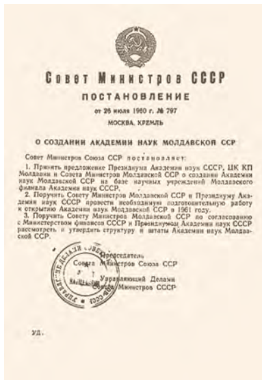
26 июля 1960 года