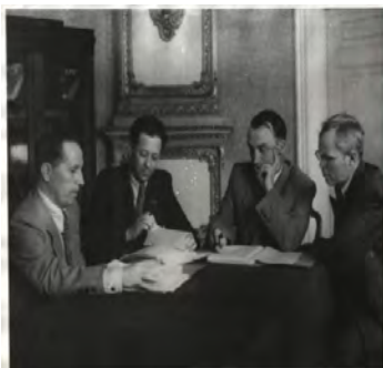
Начало 50-х годов