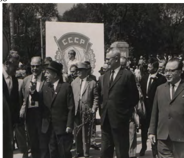
Середина 60-х годов