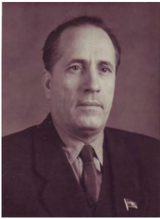
Начало 60-х годов