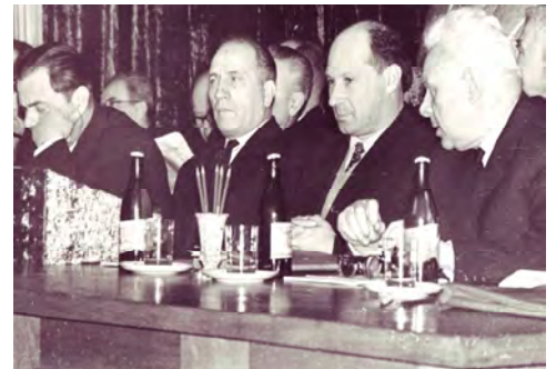
Начало 60-х годов