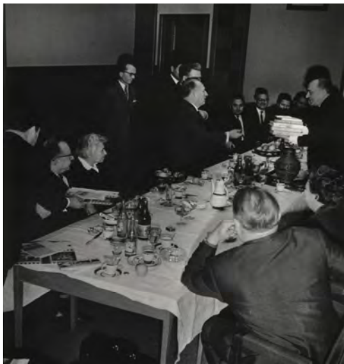
Середина 60-х годов