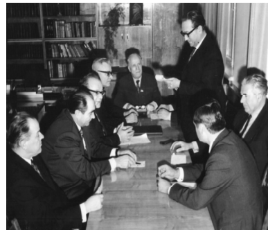
Конец 50-х годов