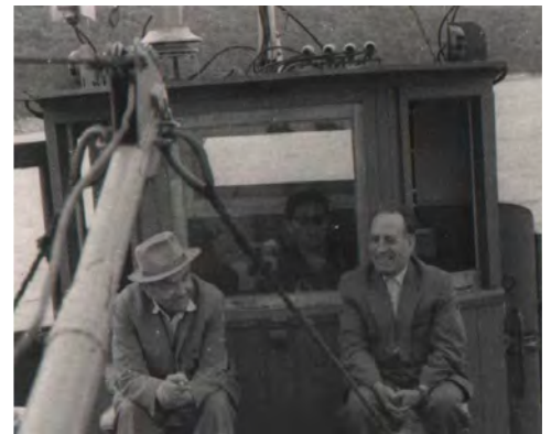
Начало 60-х годов, с акад. М.Ф. Ярошенко