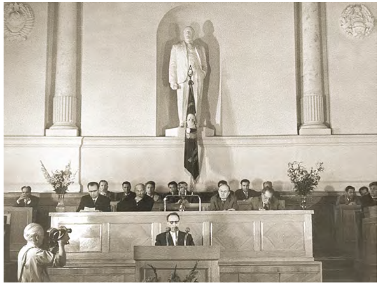
3 августа 1961 года