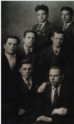
1937 год, во 2-м ряду