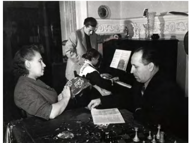
В кругу семьи, конец 50-х годов