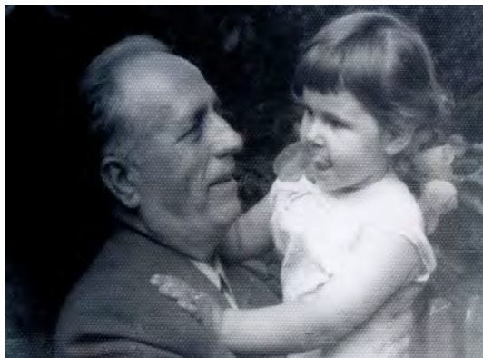
С внучкой Дориной, 1971 год