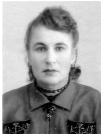
Жена, начало 50-х годов