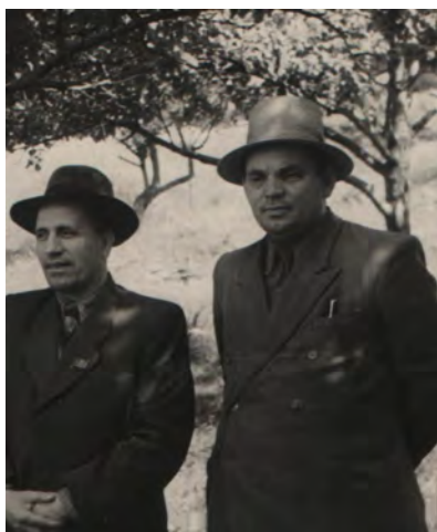
Начало 50-х годов