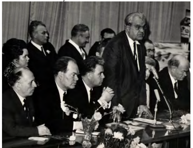
Начало 70-х годов